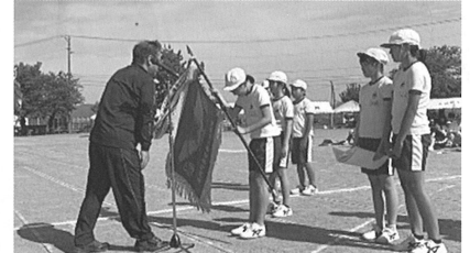
▲表彰式の様子【総合優勝 跡チーム】