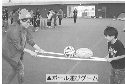
▲ボール運びゲーム

①開編式&軽スポーツ体験5月11日(土) 今年度最初の『わいわい広場』は、ほたるドームで開編式と軽スポーツ体験を行いました。昨年に引き続き第二公民館『わくわく親子塾』との合同開催で、総勢50名が参加。コマっち*わくわくクラブのスタッフを講師に迎え、用具を使った色々な運動を教えてくださいました。 2本の棒でボールを挟み、ゴールまで運ぶ「ボール運びゲーム」、赤と青の円盤を裏表に返しながらチームの色を増やしていく「カラーディスクゲーム」など、公民館対決や親子対決で大いに盛り上がりました。最後は大人と子どもに分かれてのじゃんけんゲーム! 大興奮の中、楽しい時間はあっという間に過ぎ、親子の絆もすっかり深めることができました。