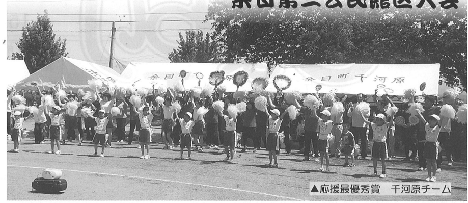
▲応援最優秀賞 千河原チーム

快晴の中行われた町民運動会は第14回目を迎え、各チーム熱の入った戦いが繰り広げられました。今年も僅差の戦いとなりましたが、多くの競技で上位を占めた跡チームが3年ぶりの総合優勝に返り咲きました。応援部門では、子どもたちのダンスにあわせ、大人も一緒に息のそろった華やかなパフォーマンスを発揮した千河原チームが最優秀賞に輝きました。綱引きでは、廿六木チームが圧倒的なパワーを発揮し、連覇を達成しました。大会の開催にあたり、競技と応援に奮闘された地域の皆さん、また実行委員をはじめ大会役員、競技役員としてご協力いただいた多くの皆さんに感謝申し上げます。