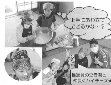
上手にあわ立てできるかな…?

①ロールケーキ作り5月12日(日) 第1回目の『平成ひまわり組』は、班のみんなで協力してロールケーキを作りました。生クリームを泡立てるのは、慣れていないと中々大変なようで何度も交代し、ふわふわの生クリームを作りました。自分で飾り付けをしたケーキは個性たっぷり。旬の苺もあいまってとってもおいしかったです。