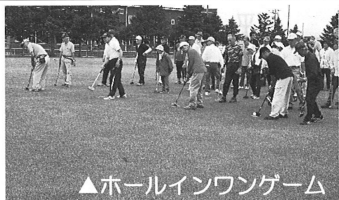
▲ホールインワンゲーム