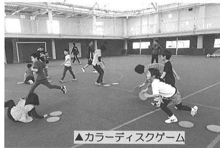
▲カラーディスクゲーム